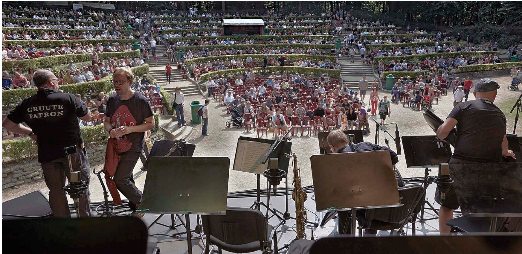
UMO vieraili Brosella Jazz Festivalilla Brysselissä kesäkuussa.