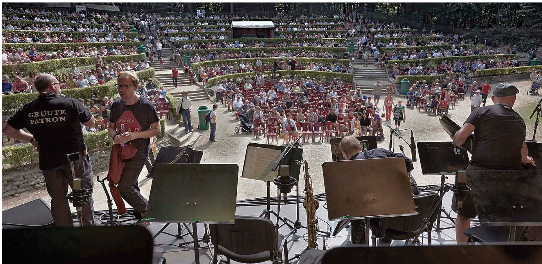
UMO gästade Brosella Jazz & Folk Festival i Bryssel i juni.