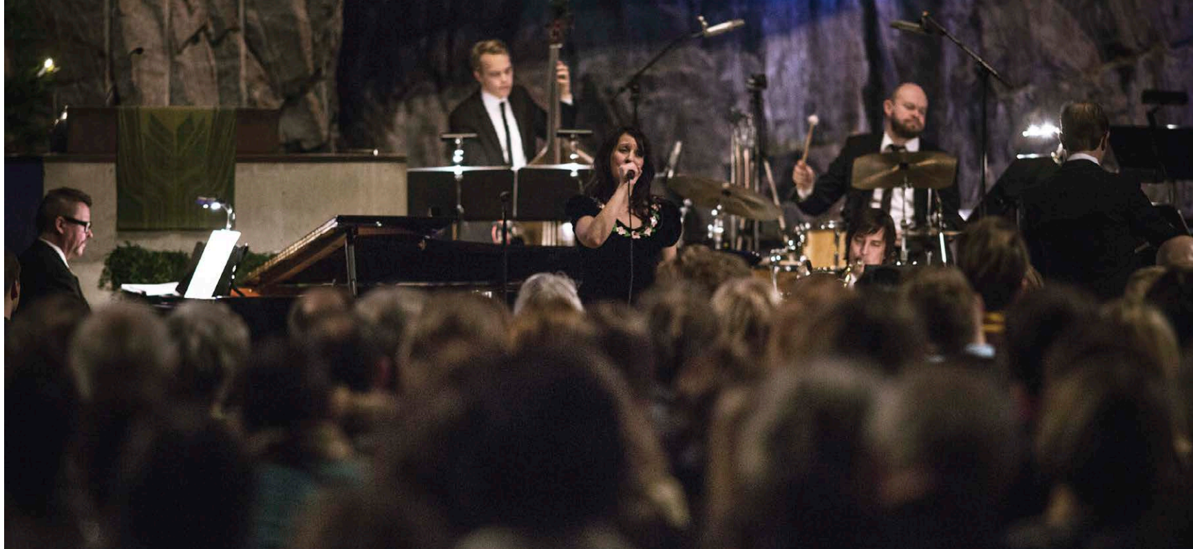
Det lider mot jul - Vuokko Hovatta & UMO.

25.9.2013 • MALMS KULTURHUS, HELSINGFORS The New Way - UMO & Jorma Kalevi Louhivuori Kapellmästare: Kari Heinilä