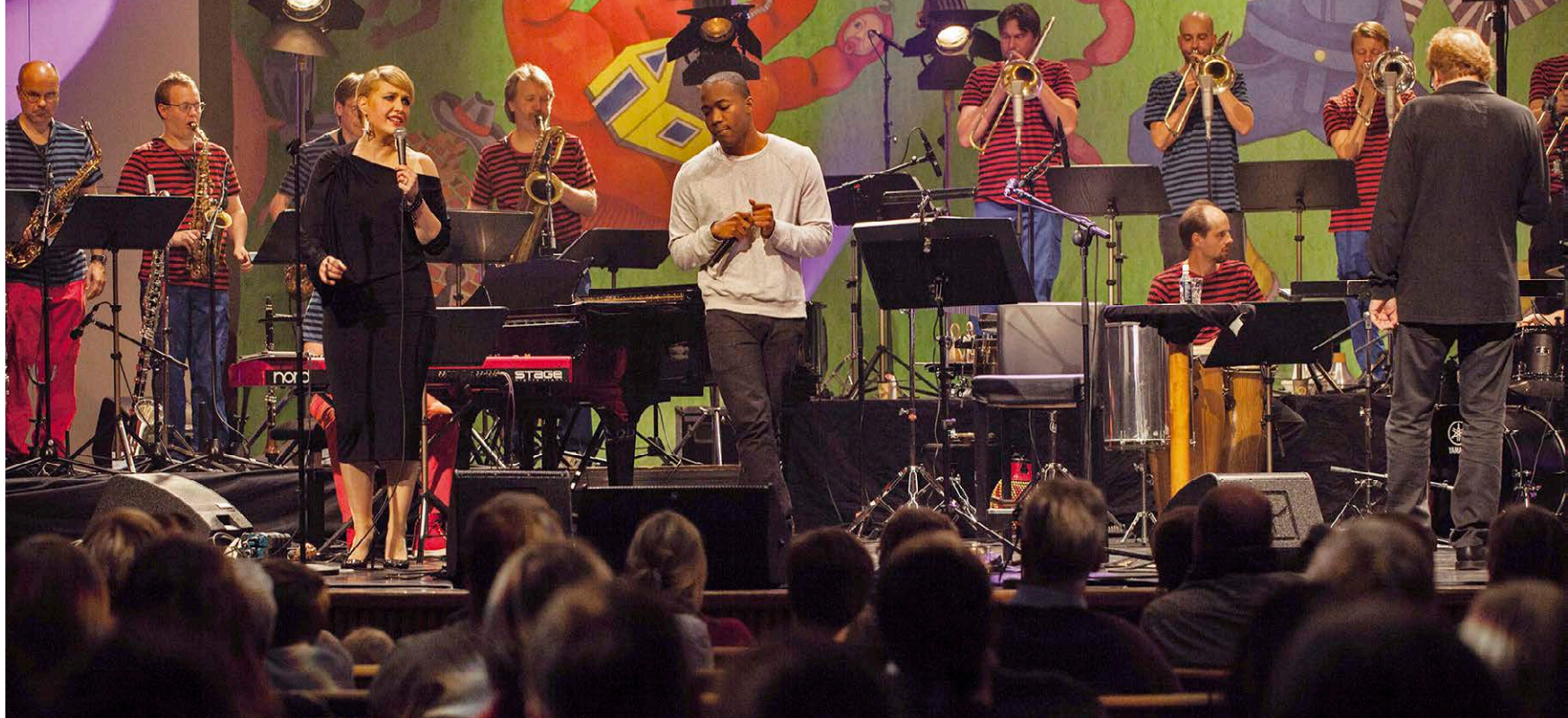
Ville ja Valle - UMO & Vesa-Matti Loiri och Johanna Försti feat. Gracias