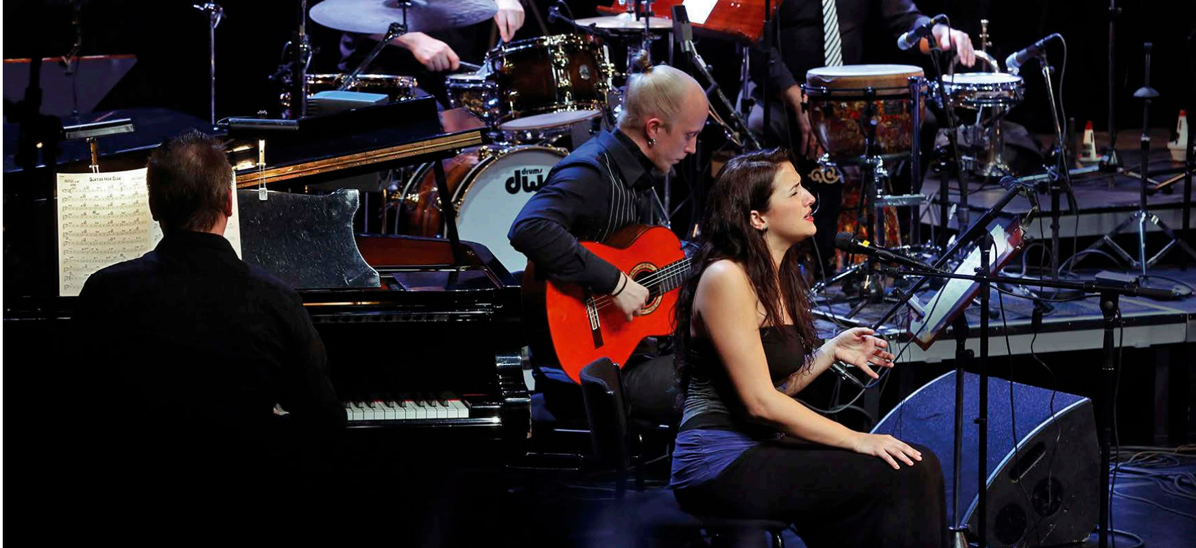
Flamenco Big Band - UMO feat. Perico Sambeat.