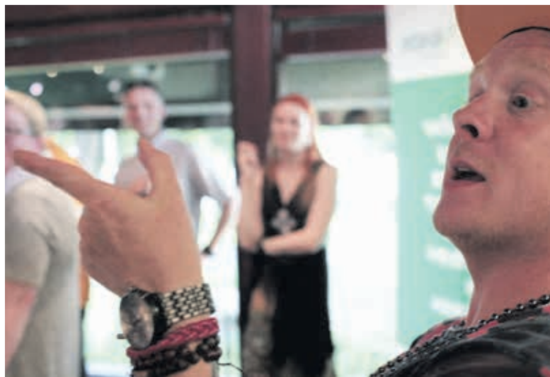
Redraman opastuksella eteralaiset pääsivät tutustumaan riittelyn ihmeelliseen maailmaan.

Viimeisen silauksen kappaleelle antoi UMO:n vaikuttava sointi, jonka